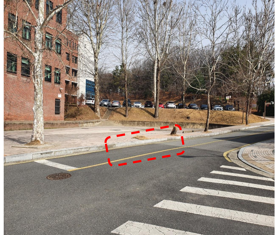
주차장 조성공간 13대(장애인1대, 확장형10대, 경차2대)